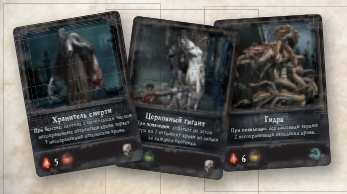
17 карт монстров