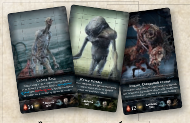
8 карт главных боссов