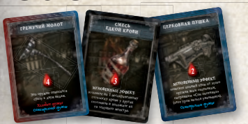
38 карт улучшений