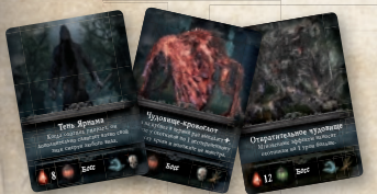
8 карт боссов