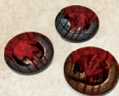
15 жетонов смерти