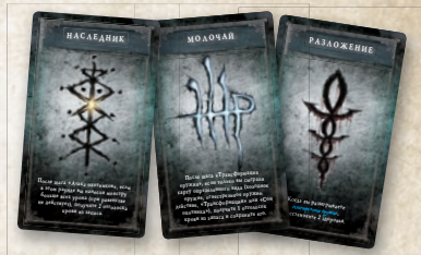
12 карт рун